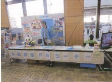
(福井テレビまつりによるPR)