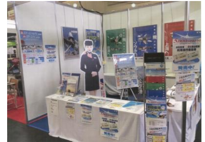
(機械工業見本市金沢におけるPR)