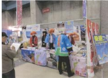
(うどん大会2015におけるPR)