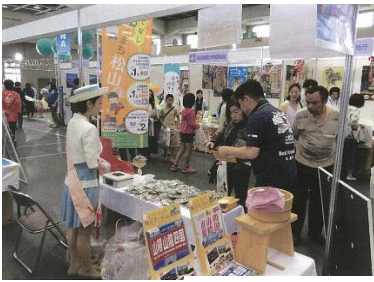
(旅フェスタによるPR)