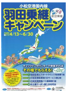
(乗継キャンペーンチラシ)