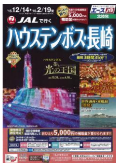
(乗継相互商品造成)