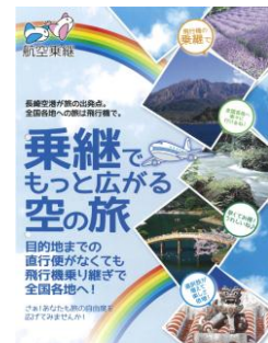
(乗継パンフレット)