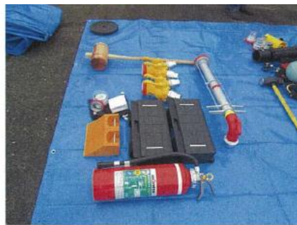
消火栓金具 ホースブリッジ 車輪止 二又分岐 掛矢