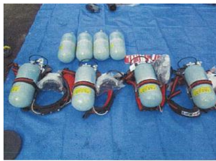
空気呼吸器 空気ポンプ