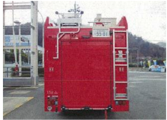
(東広島消防団河内東分団が更新した消防ポンプ自動車)