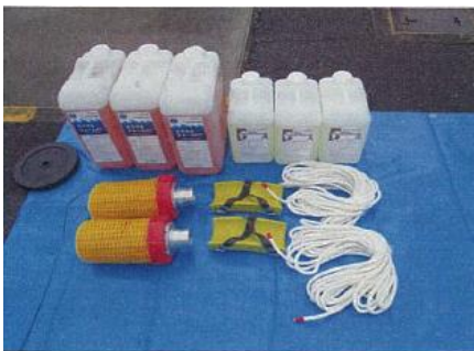
クラスA泡消火薬剤(訓練用含む) 吸管ちりよけ籠 枕木 吸管ロープ