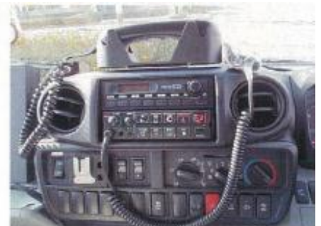
キャビン内無線送受信器 サイレン操作部