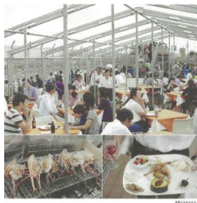
（日本の「玄関口」羽田空港に 全国の美味しいものが集結！）

一日に数万台の国内飛行機が離陸し、 年に数千億円の飛行機が往来する日本の玄関口、羽田空港。 その玄関口に、全国の美味しいものが集結する「空の日」開催します。 ◎特産品を売り、羽田空港線では、一日限りの「空飛ぶおとぎ話」を開催。 ◎観光に日本の「おもてなし」を体験する「空の日」では、各地の名産品を味わって頂